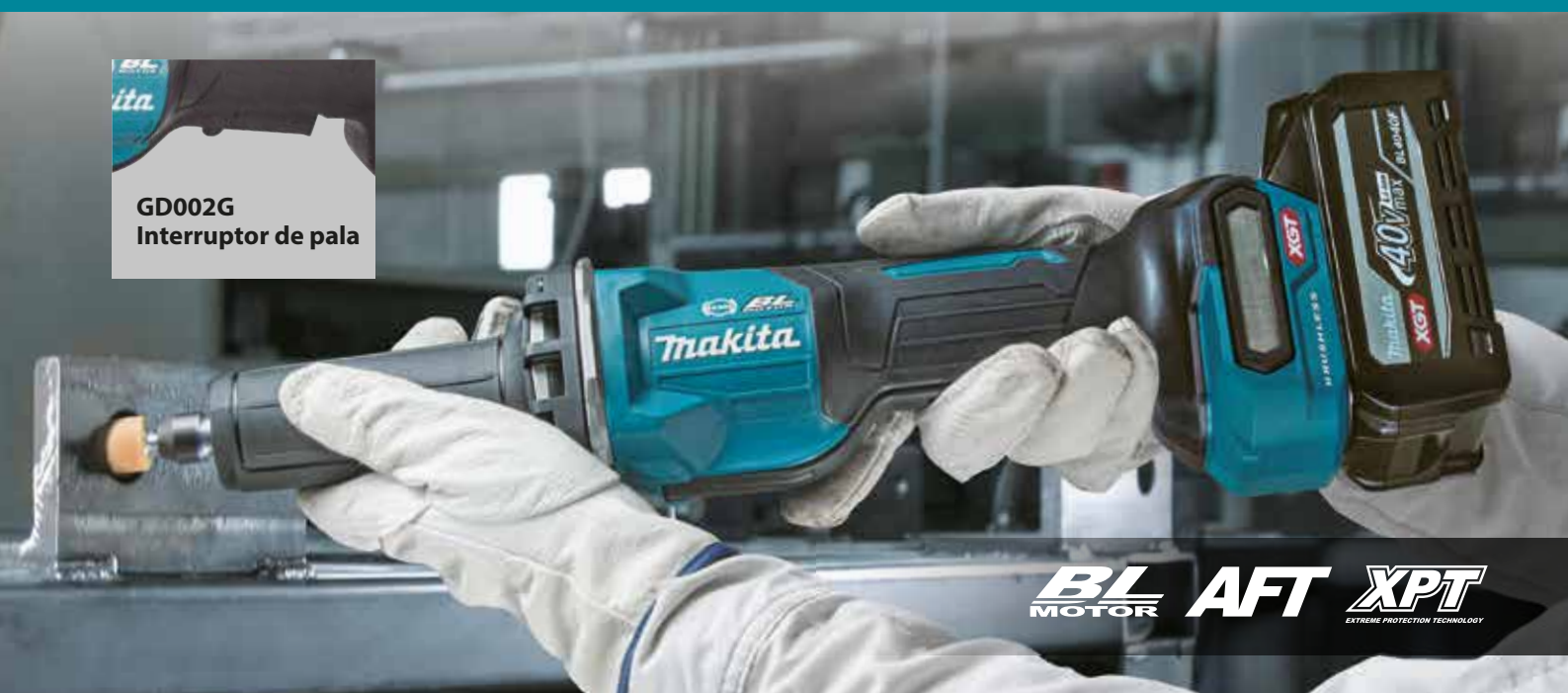
GD002G Interruptor de pala

Alta potencia para un rectificado de alta eficiencia Lijado potente para trabajos finos