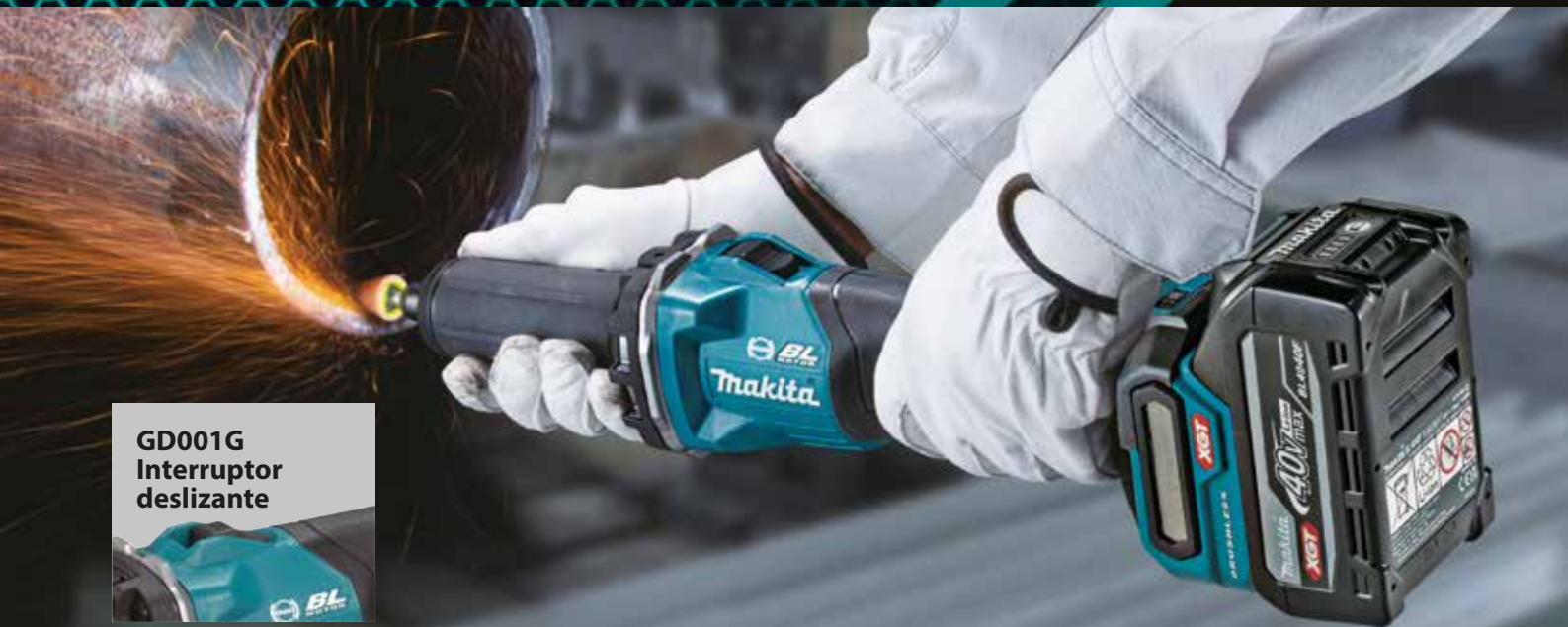
GD001G Interruptor deslizante

Alta potencia para un rectificado de alta eficiencia Lijado potente para trabajos finos