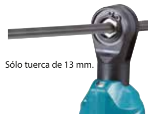
Sólo tuerca de 13 mm.

Luz LED de trabajo ilumina el área de trabajo.