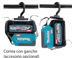
Correa con gancho (accesorio opcional)

Con la "correa con gancho" opcional fijada a los dos orificios de la correa del aparato, la luz puede utilizarse para iluminación descendente colgándola boca abajo.