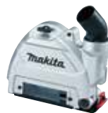
Colector de polvo. 115 - 125mm. 196845-3